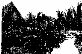
Il Jacaranda Beach Resort in Kenya.

● Swan Tour: Kenya lo offre in agosto (quattro partenze, il 5, 13, 20 e 27 agosto, da Milano e Roma per una settimana nelle cristalline acque kenyote