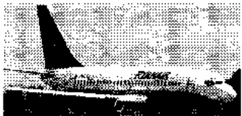
Un aereo della Ryanair

Quello dei voli low cost è un mercato in evoluzione, che cresce in volume ma anche nei costi a carico dei viaggiatori: da gennaio a giugno il prezzo medio dei biglietti è salito di circa il 19%: ritocchi all'insù in vista dell'estate che vanno da quelli minimi effettuati da Wizz e Myair (rispettivamente +1% e +3%) fino al +30% di Meridiana e al +40% della tedesca Hapagloydex. Dietro il successo che nel 2004 ha movimentato un fatturato di settore di circa 800 milioni di euro, c'è, secondo un'indagine