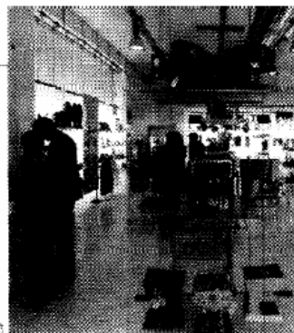
Un outlet: tra le «invenzioni» di Schmid c'è anche la catena Designers Fashion International.

Nel 1999 Schmid fonda TravelOnline, sito Internet di viaggi che nel 2003 è ceduto alla eDreams.