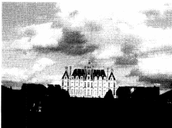
Destinazioni classiche, che non tramontano mai: Nell'altra pagina New York, qui sopra il Castello di Versailles alle porte di Parigi, a destra particolare della Sagrada Famiglia a Barcellona. Sotto, vista dall'alto di Praga