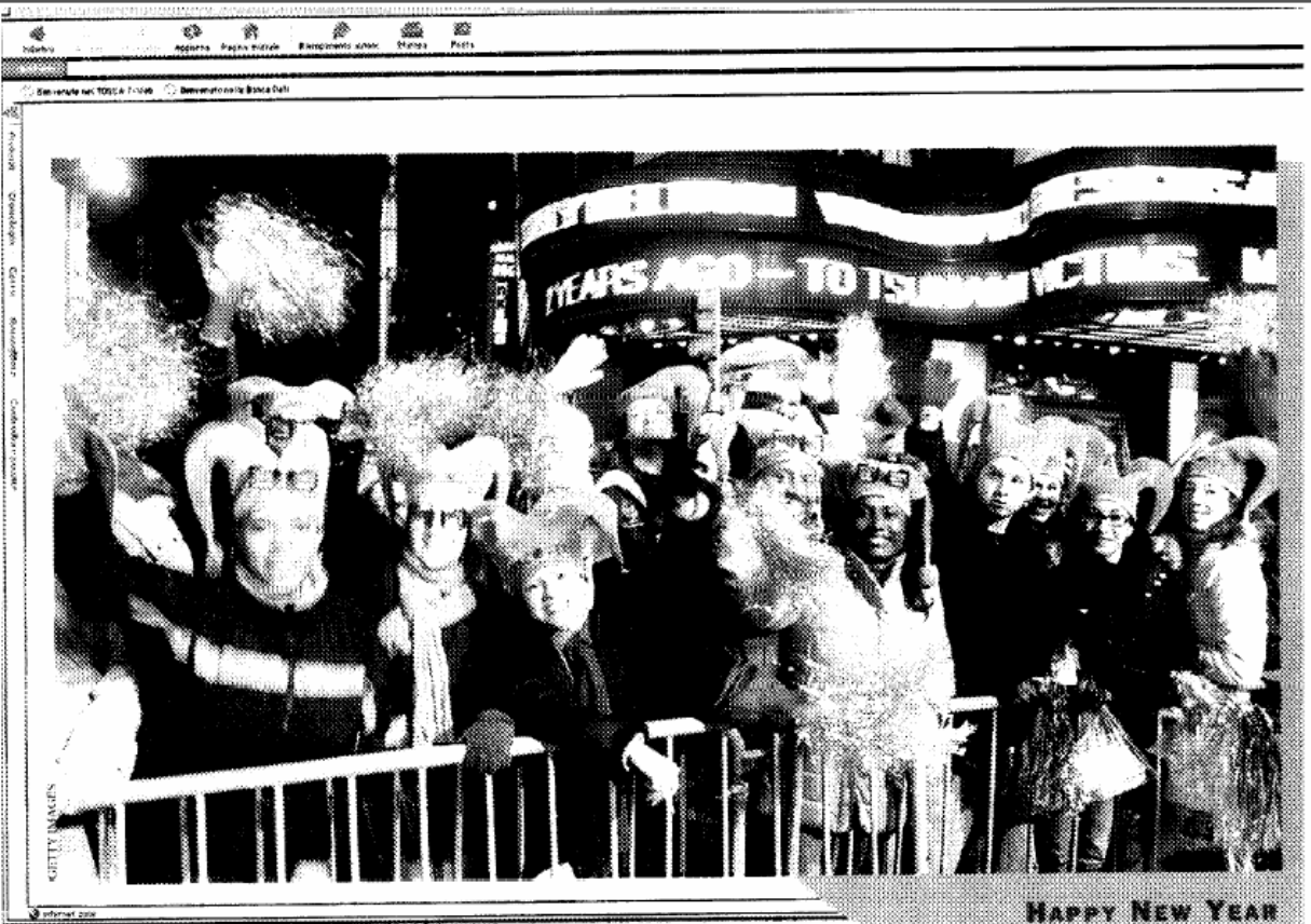
HAPPY NEW YEAR

CONTRO I RINCARI IL SUCCESSO DEI PACCHETTI TURISTICI FAI-DATE