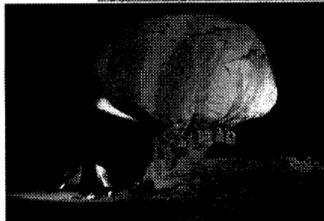
COME LAWRENCE Due immagini del Wadi Rum: da qui partì Lawrence d'Arabia per conquistare Aqaba.

Oltre ai motivi economici, alla maggiore scelta, alla possibilità di comparare offerte di operatori diversi, alla base di questo successo ci sono anche motivi emozionali. «Chi si sceglie la vacanza su internet ha la sensazione di fare un affare e di poter veramente scegliere ciò che più gli piace. È il cliente che compone il pacchetto secondo le proprie esigenze e non l'agenzia» racconta Davide Casa-