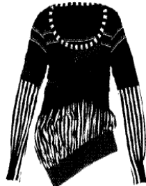
Pull asimmetrico, Pianurastudio (€ 230). Info: 06.783661.