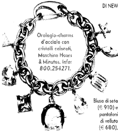
Orologio-charms d'acciaio con cristalli colorati, Maschino Hours & Minutes. Info: 800.254271.