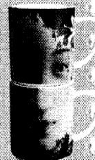
Set di due tazze di porcellana con stampa componibile, Habitat (€ 15). Info: www.habitat.net .