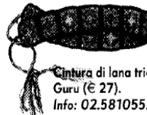
Cintura di lana tricot, Guru (€ 27). Info: 02.58105520.