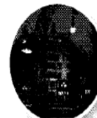
Un weekend per due a Barcellona, sulle tracce del romanzo di stagione: L'ombra del vento di Carlos Ruiz Zafón, Mondadori, (€ 25). Con edreams, voli a partire da € 22, da Milano Malpensa. Info: www.edreams.it .